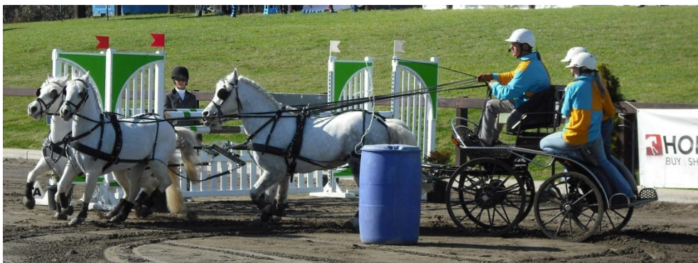
Pokaz powożenia podczas Światowych Igrzysk Jeździeckich w Australii